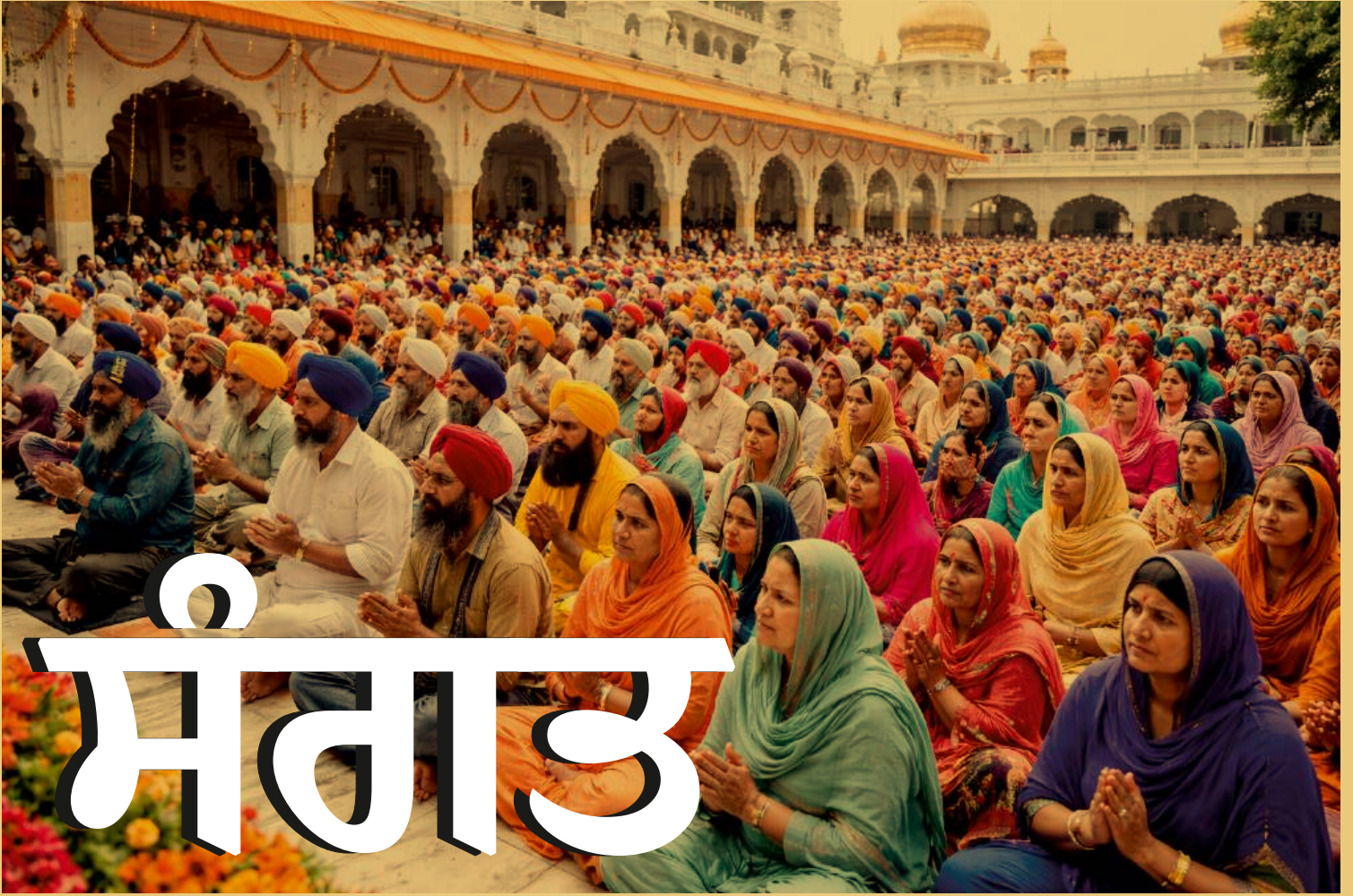
ਪਰਬਤ ਤੋਂ ਢਲਦੇ ਪਾਣੀ ਦੀ ਤੇਜ਼ੀ ਵਾਂਗ ਡਿੱਗ ਰਿਹਾ। ਇਹ ਸੰਗਤ ਦਾ ਹੀ ਫਲ ਹੁੰਦਾ ਹੈ। ਜੇ ਕੰਗਾਲਾਂ ਦੇ ਪੁੱਤਰ ਧਨੀ, ਅਨਪੜ੍ਹਾਂ ਦੇ ਚਤੁਰ, ਕਾਇਰਾਂ ਦੇ ਬੀਰ ਤੇ ਬਦਾਂ ਦੇ ਭਲੇ ਹੋ ਜਾਂਦੇ ਦਿਸ ਆਉਂਦੇ ਹਨ ਤਾਂ ਉਹ ਕੇਵਲ ਚੰਗੀ ਸੰਗਤ ਦੇ ਆਸਰੇ, ਤੇ ਜਦੋਂ ਇਸ ਦੇ ਐਨ ਉਲਟ ਧਨੀਆਂ ਦੇ ਕੰਗਾਲ, ਚਾਤਰਾਂ ਦੇ ਮੂਰਖ, ਬੀਰਾਂ ਦੇ ਕਾਇਰ ਤੇ ਨੇਕਾਂ ਦੇ ਬਦ ਮਿਲਣ ਤਾਂ ਨਿਸਚੇ ਇਹ ਕੁਸੰਗਤ ਦਾ ਹੀ ਫਲ ਹੁੰਦਾ ਹੈ। ਖੋਟੀਆਂ ਸੰਗਤਾਂ ਵਿਚ ਬੈਠੇ ਹੋਏ ਇਨਸਾਨ, ਜੀਵਨ ਰਾਸ ਹੀ ਗਵਾ ਬਹਿੰਦੇ ਹਨ। ਕਬੀਰ ਸਾਹਿਬ ਦੇ ਬਚਨ ਅਨੁਸਾਰ ਕੁਸੰਗਤ ਦੀ ਮਾਰ ਮਨੁੱਖ ਨੂੰ ਅਜਿਹੀ ਪੈਂਦੀ ਹੈ, ਜਿਸ ਤਰ੍ਹਾਂ ਬੇਰੀ ਦੇ ਬੂਟੇ ਦੇ ਪਾਸ ਉੱਗੇ ਹੋਏ ਕੇਲੇ ਦਾ ਹਾਲ ਹੁੰਦਾ ਹੈ। ਜਿਉਂ ਜਿਉਂ ਬੇਰੀ ਪਸਰਦੀ ਹੈ, ਉਹ ਗ਼ਰੀਬ ਚੀਰੀਦਾ ਹੈ। ਅਮਲੀਆਂ ਤੇ ਸ਼ਰਾਬੀਆਂ ਦੀ ਕੁਸੰਗਤ ਬੜੇ ਬੜੇ ਪਰਹੇਜ਼ਗਾਰਾਂ ਨੂੰ ਗਿਰਾ ਦਿੰਦੀ ਹੈ। ਨੀਤੀ ਵਿਚ ਲਿਖਿਆ ਹੈ ਕਿ ਮਨੁੱਖ ਸ਼ੇਰਾਂ ਨਾਲ ਭਰੇ ਹੋਏ ਬਣ ਵਿਚ ਤਾਂ ਭਾਵੇਂ ਵੱਸ ਪਵੇ, ਡੂੰਘੇ ਪਾਣੀ ਵਿਚ ਧਸ ਜਾਵੇ, ਭਾਵੇਂ ਬਿੰਛੂ ਨੂੰ ਹੱਥ ਵਿਚ ਫੜ ਲਵੇ, ਕੰਨ ਖਜੂਰੇ ਨੂੰ ਕੰਨ ਵਿਚ ਦਿਵਾ ਲਏ, ਸੱਪ ਦੇ ਮੂੰਹ ਵਿਚ ਉਂਗਲੀ ਦੇ ਦੇਵੇ, ਪਹਾੜ ਤੋਂ ਛਾਲ ਮਾਰ ਲਵੇ ਤੇ ਆਰੇ ਹੇਠਾਂ ਭਾਵੇਂ ਚਿਰ ਜਾਏ, ਪਰ ਮੂਰਖ ਦੀ ਸੰਗਤ ਨਾ ਕਰੇ: ਸਿੰਘਨ ਕੇ ਬਨ ਮੇ ਬਸੀਏ ਘਸੀਏ, ਕਰ ਮੇਂ ਬਿਛੂਵਾ ਗਹਿ ਲੀਜੇ। ਕਾਨ ਖਜੂਰ ਪ੍ਰਵੇਸ ਕਰਾਇ ਕਿ, ਸਾਂਧ ਕੇ ਮੁਖ ਮੇਂ ਉਂਗਰੀ ਦੀਜੇ। ਗਿਰ ਤੇ ਗਿਰੀਏ ਅਗ ਮੇ ਜਰੀਏ, ਔਰ ਆਰੀ ਕੇ ਘਾਵ ਅਨੇਕ ਸਹੀਜੇ। ਏਤੇ ਤੇ ਕਸ਼ਟ ਅਨੰਤ ਸਹੇ, ਪਰ ਮੂਰਖ ਮੀਤ ਕੇ ਸੰਗ ਨ ਕੀਜੇ। ਕੁਸੰਗਤ ਇਨਸਾਨ ਨੂੰ ਮਾਰਦੀ ਹੈ ਤੇ ਸੁੱਭ ਸੰਗਤ ਜੀਵਾਂਦੀ ਹੈ। ਸੁੱਭ ਸੰਗਤ ਕੀ ਹੈ? ਇਸ ਦਾ ਉੱਤਰ ਸਤਿਗੁਰੂ ਇਸ ਤਰ੍ਹਾਂ ਦਿੰਦੇ ਹਨ ਕਿ ਉਤਮ ਸੰਗਤ ਉਹ ਹੈ, ਜਿਸ ਕਰਕੇ ਮਨੁੱਖ ਗੁਣਾਂ ਵੱਲ ਧਾਵਦਾ ਹੈ ਤੇ ਔਗੁਣਾਂ ਨੂੰ ਧੋ ਕੇ ਬਾਹਰ ਕੱਢਦਾ ਹੈ। ਇਹ ਗੁਣਾਂ ਵੱਲ ਧਾਵਣਾ ਮਨੁੱਖ ਦਾ ਸੁਭਾਵਕ ਕਰਤਬ ਹੈ। ਸੇ ਜਿਉਂ ਜਿਉਂ ਉਹ ਗੁਣਾਂ ਵੱਲ ਵਧਦਾ ਜਾਏਗਾ ਤਿਉਂ ਤਿਉਂ ਉਚੇਰਾ ਹੋਵੇਗਾ। ਸੰਸਾਰ ਦੇ ਇਤਿਹਾਸ ਵਿਚ ਅਜਿਹੀਆਂ ਮਿਸਾਲਾਂ ਦੀ ਕੋਈ ਕਮੀ ਨਹੀਂ, ਜਿਨ੍ਹਾਂ ਤੋਂ ਪਤਾ ਲਗਦਾ ਹੋਵੇ ਕਿ ਗਿਰੇ ਤੋਂ ਗਿਰੇ ਹੋਏ ਮਨੁੱਖ ਭਲੀ ਸੰਗਤ ਮਿਲਣ ਕਰਕੇ ਬਹੁਤ ਉਚੇਰੇ ਹੋ ਗਏ। ਪੱਛਮ ਦਾ ਇਕ ਮਸ਼ਹੂਰ ਲਿਖਾਰੀ ਕਹਿੰਦਾ ਹੈ ਕਿ ਮੈਂ ਜਿਉਂ ਜਿਉਂ ਵਡੇਰਾ ਹੁੰਦਾ ਜਾਂਦਾ ਹਾਂ, ਮੈਨੂੰ ਯਕੀਨ ਆ ਰਿਹਾ ਹੈ ਕਿ ਨਿਰੀਆਂ ਪੋਥੀਆਂ ਫੋਲਿਆਂ ਭਾਵੇਂ ਲਖ ਯਤਨ ਕਰੀਏ, ਵਿਦਿਆ ਨਹੀਂ ਲੱਭਦੀ। ਉਸ ਦੇ ਖ਼ਜ਼ਾਨੇ ਤਾਂ ਵੱਡੇ ਨਰ ਨਾਰੀਆਂ ਦੀ ਸੰਗਤ ਵਿਚ ਦੱਬੇ ਹੋਏ ਹਨ। ਬੰਦੇ ਲਈ ਵਾਜਬ ਹੈ ਕਿ ਉਹ ਵਡੇਰੇ ਦਿਲਾਂ ਵਿਚੋਂ ਖੋਜ ਕਰੇ, ਜੇ ਸਾਡੇ ਕਾਲਜ ਤੇ ਸਕੂਲਾਂ ਨੂੰ ਪੁਸਤਕਾਂ ਦੀ ਥਾਂ ਬੰਦੇ ਵਾਚਣ ਦਾ ਵੰਗ ਲੱਭ ਪਵੇ ਤਾਂ ਬਿਗੜੀ ਅੱਜ ਹੀ ਬਣ ਜਾਏ: ਜਿਉਂ ਜਿਉਂ ਮੈਂ ਵਡੇਰਾ ਹੋਵਾਂ, ਨਿਸ਼ਚਾ ਹੁੰਦਾ ਜਾਵੇ। ਪੋਥੇ ਫੋਲੇ ਇਲਮ ਨਹੀਂ ਲਭਦਾ, ਜੇ ਸਓ ਯਤਨ ਕਰਾਵੇ। ਵਡ ਨਰ ਨਾਰਾਂ ਦੀ ਸੰਗਤ, ਇਲਮ ਖ਼ਜ਼ਾਨੇ ਦਬੇ। ਵਾਜਬ ਹੈ ਪੋਥੀ ਦੀ ਥਾਂ, ਜਾ ਬੰਦਾ ਉਥੋਂ ਲਭੇ। ਸਾਡੇ ਕਾਲਜ ਮਦਰੱਸਿਆਂ ਨੂੰ, ਮੈਂ ਚਾਹਦਾਂ ਵਥ ਆਵੇ। ਪੁਸਤਕ ਦੀ ਥਾਂ ਬੰਦੇ ਵਾਚਣ ਤਾਂ ਬਿਗੜੀ ਬਣ ਜਾਵੇ। ਸੰਤ ਕਬੀਰ ਜੀ ਨੇ ਤਾਂ ਇਸ ਬਿਆਨ ਵਿਚ ਸਿਰੇ ਦੀ ਗੱਲ ਕਹਿ ਦਿੱਤੀ ਹੈ। ਆਪ ਕਹਿੰਦੇ ਹਨ ਕਿ ਜਿਸ ਤਰ੍ਹਾਂ ਚੰਦਨ ਦੇ ਨਾਲ ਰਲ ਕੇ ਲੱਕੜੀ, ਗੰਗਾ ਦੇ ਨਾਲ ਰਲ ਹੋਰ ਨਦੀਆਂ, ਖੁਸ਼ਬੂਦਾਰ ਤੇ ਪਵਿੱਤਰ ਹੋ ਜਾਂਦੀਆਂ ਹਨ ਤੇ ਪਾਰਸ ਨਾਲ ਲਗ ਧਾਤ, ਸੋਨਾ ਬਣਦੀ ਹੈ, ਉਸੇ ਤਰ੍ਹਾਂ ਹੀ ਕਬੀਰ ਸੰਤਾਂ ਦੀ ਸੰਗਤ ਕਰ ਰਾਮ ਹੋ ਗਿਆ ਹੈ: ਸੰਤਨ ਸੰਗਿ ਕਬੀਰਾ ਬਿਗਰਿਓ।। ਸੇ ਕਬੀਰ ਰਾਮੇ ਹੋਇ ਨਿਬਰਿਓ।। (ਭੈਰਉ ਕਬੀਰ, ਅੰਗ ੧੧੫੮)

ਪਰਬਤ ਤੋਂ ਢਲਦੇ ਪਾਣੀ ਦੀ ਤੇਜ਼ੀ ਵਾਂਗ ਡਿੱਗ ਰਿਹਾ। ਇਹ ਸੰਗਤ ਦਾ ਹੀ ਫਲ ਹੁੰਦਾ ਹੈ। ਜੇ ਕੰਗਾਲਾਂ ਦੇ ਪੁੱਤਰ ਧਨੀ, ਅਨਪੜ੍ਹਾਂ ਦੇ ਚਤੁਰ, ਕਾਇਰਾਂ ਦੇ ਬੀਰ ਤੇ ਬਦਾਂ ਦੇ ਭਲੇ ਹੋ ਜਾਂਦੇ ਦਿਸ ਆਉਂਦੇ ਹਨ ਤਾਂ ਉਹ ਕੇਵਲ ਚੰਗੀ ਸੰਗਤ ਦੇ ਆਸਰੇ, ਤੇ ਜਦੋਂ ਇਸ ਦੇ ਐਨ ਉਲਟ ਧਨੀਆਂ ਦੇ ਕੰਗਾਲ, ਚਾਤਰਾਂ ਦੇ ਮੂਰਖ, ਬੀਰਾਂ ਦੇ ਕਾਇਰ ਤੇ ਨੇਕਾਂ ਦੇ ਬਦ ਮਿਲਣ ਤਾਂ ਨਿਸਚੇ ਇਹ ਕੁਸੰਗਤ ਦਾ ਹੀ ਫਲ ਹੁੰਦਾ ਹੈ। ਖੋਟੀਆਂ ਸੰਗਤਾਂ ਵਿਚ ਬੈਠੇ ਹੋਏ ਇਨਸਾਨ, ਜੀਵਨ ਰਾਸ ਹੀ ਗਵਾ ਬਹਿੰਦੇ ਹਨ। ਕਬੀਰ ਸਾਹਿਬ ਦੇ ਬਚਨ ਅਨੁਸਾਰ ਕੁਸੰਗਤ ਦੀ ਮਾਰ ਮਨੁੱਖ ਨੂੰ ਅਜਿਹੀ ਪੈਂਦੀ ਹੈ, ਜਿਸ ਤਰ੍ਹਾਂ ਬੇਰੀ ਦੇ ਬੂਟੇ ਦੇ ਪਾਸ ਉੱਗੇ ਹੋਏ ਕੇਲੇ ਦਾ ਹਾਲ ਹੁੰਦਾ ਹੈ। ਜਿਉਂ ਜਿਉਂ ਬੇਰੀ ਪਸਰਦੀ ਹੈ, ਉਹ ਗ਼ਰੀਬ ਚੀਰੀਦਾ ਹੈ। ਅਮਲੀਆਂ