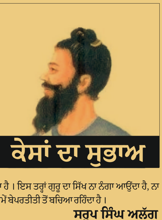
ਕੇਸਾਂ ਦਾ ਸੁਭਾਅ ਸਰੂਪ ਸਿੰਘ ਅਲੱਗ

ਕੇਸਾਂ ਨਾਲ ਸੁਸਜਤ ਹੁੰਦਾ ਹੈ ਜੋ ਰੱਬ ਉਸ ਨੂੰ ਤੋਰਫੇ ਵਜੋਂ ਦੇ ਕੇ ਇਸ ਸੰਸਾਰ ਵਿੱਚ ਭੇਜਦਾ ਹੈ ਪਰ ਇਹ ਗੱਲ ਵੱਖਰੀ ਹੈ ਕਿ ਸਿੱਖ ਤੋਂ ਬਿਨਾਂ ਬਾਕੀ ਸੰਸਾਰ ਦੇ ਲੱਗਭਗ ਸਾਰੇ ਪੁਰਖ ਵਿਅਕਤੀ ਰੱਬ ਦੀ ਨਾ ਤਾਂ ਰਮਜ ਹੀ ਪਛਾਣਦੇ ਹਨ ਤੇ ਨਾ ਹੀ ਉਸ ਦੇ ਅਣਮੋਲ ਤੋਰਫੇ ਦਾ ਸਨਮਾਨ ਕਰਨ ਦੇ ਮੂਡ ਵਿੱਚ ਹੀ ਹਨ। ਉਂਜ ਮਨੁੱਖ ਆਪਣੇ ਆਪ ਨੂੰ ਬਹੁਤ ਸ੍ਰਿਸ਼ਟਾਚਾਰ ਵਾਲਾ ਕਹਿੰਦਾ ਹੈ। ਹਾਂ, ਸਿੱਖ ਧਰਮ ਦਾ ਪੈਰੋਕਾਰ ਇਹ ਜ਼ਰੂਰ ਸਮਝਦਾ ਹੈ ਕਿ ਵਾਹਿਗੁਰੂ ਨੇ ਸੁੱਚੇ ਰੋਮਾਂ ਨਾਲ ਉਸ ਦੇ ਸਰੀਰ ਨੂੰ ਪੇਸ਼ਾਕ ਰੂਪ ਵਿੱਚ ਸਜਾ ਕੇ ਇਸ ਸੰਸਾਰ ਵਿੱਚ ਭੇਜਿਆ ਹੈ ਅਤੇ ਮਰਨ ਵੇਲੇ ਵੀ ਕੇਸਾਂ ਦੇ ਰੂਪ ਵਿੱਚ ਇਹ ਰੋਸ਼ਮੀ ਚੰਦੋਆ ਉਸ ਉੱਪਰ ਹੁੰਦਾ ਹੈ। ਇਸ ਤਰ੍ਹਾਂ ਗੁਰੂ ਦਾ ਸਿੱਖ ਨਾ ਨੰਗਾ ਆਉਂਦਾ ਹੈ, ਨਾ ਨੰਗਾ ਜਾਂਦਾ ਹੈ ਤੇ ਇਨ੍ਹਾਂ ਰੋਮਾਂ ਦੀ ਬਦੌਲਤ ਹਰ ਸਮੇਂ ਬੇਪਰਤੀਤੀ ਤੋਂ ਬਚਿਆ ਰਹਿੰਦਾ ਹੈ।