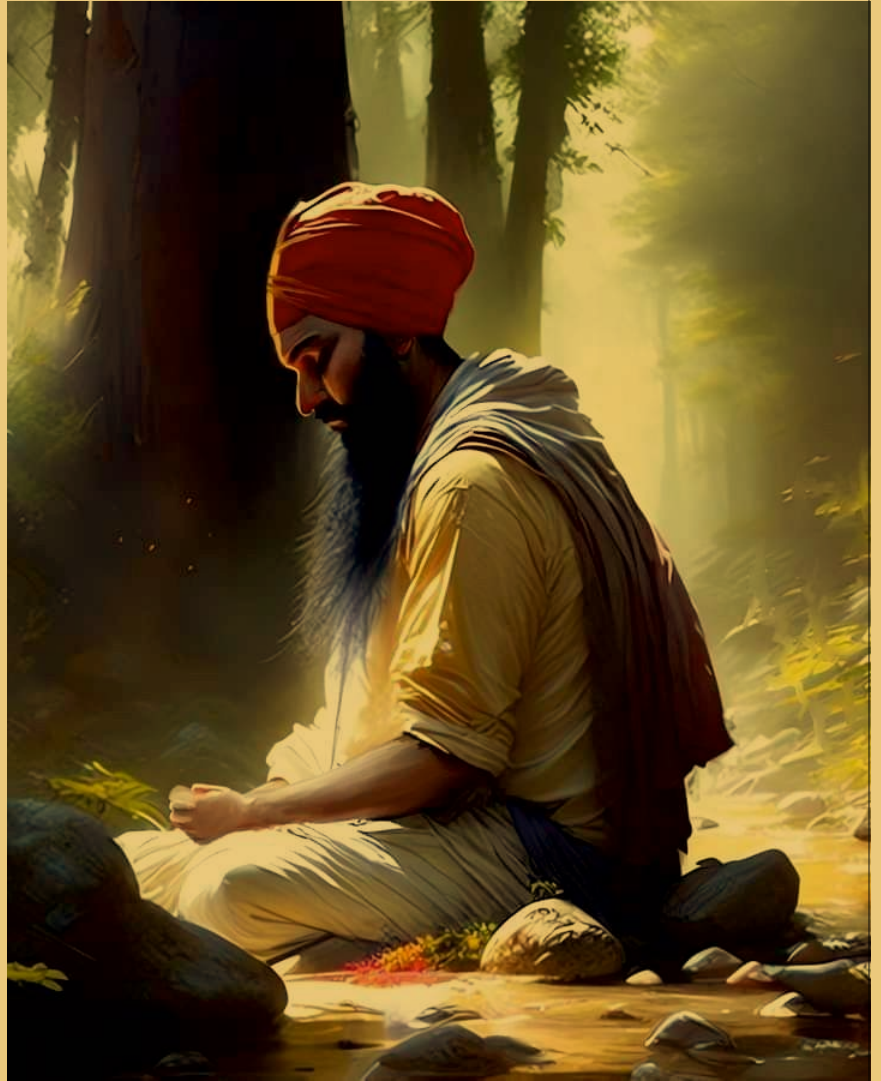
ਫੁਰਮਾਨ ਹੈ- ਹਰਿ ਕੇ ਨਾਮ ਬਿਨਾ ਦੁਖੁ ਪਾਵੈ ॥ ਭਗਤਿ ਬਿਨਾ ਸਰਸਾ ਨਹ ਚੁਕੈ ਗੁਰੁ ਇਹੁ ਭੇਦੁ ਬਤਾਵੈ ॥ (ਅੰਗ ੮੩੦)

ਨਾਮ ਦੇ ਟਾਕਰੇ 'ਤੇ ਬਾਕੀ ਸਾਰੇ ਕਰਮ-ਕਾਂਡ ਵਿਅਰਥ ਹਨ। ਇਕ ਸ਼ਬਦ ਵਿੱਚ ਗੁਰੂ ਅਰਜਨ ਦੇਵ ਜੀ ਨੇ ਅਨੇਕਾਂ ਕਰਮ-ਕਾਂਡਾਂ ਦਾ ਜ਼ਿਕਰ ਕੀਤਾ ਹੈ ਤੇ ਅਖੀਰ ਵਿੱਚ ਕਹਿ ਦਿੱਤਾ ਕਿ ਸਾਧ-ਸੰਗਤ ਨਾਲ ਮਿਲਕੇ ਪ੍ਰਮਾਤਮਾ ਦੇ ਗੁਣ ਗਾਉਣੇ ਸਭ ਤੋਂ ਉੱਤਮ ਕਰਮ ਹੈ ਪਰ ਸੰਗਤ ਪ੍ਰਭੂ ਦੀ ਕਿਰਪਾ ਨਾਲ ਮਿਲਦੀ ਹੈ- ਹਰਿ ਕੀਰਤਿ ਸਾਧਸੰਗਤਿ ਹੈ ਸਿਰਿ ਕਰਮਨ ਕੈ ਕਰਮਾ ॥ ਕਹੁ ਨਾਨਕ ਤਿਸੁ ਭਇਓ ਪਰਾਪਤਿ ਜਿਸੁ ਪੁਰਬ ਲਿਖੇ ਕਾ ਲਹਨਾ ॥ (ਅੰਗ ੬੪੨) ਨਾਮ ਤੋਂ ਬਿਨਾਂ ਮਨੁੱਖ ਦਾ ਹਿਰਦਾ ਵਿਕਾਰਾਂ ਦੀ ਅੱਗ ਵਿੱਚ ਸੜਦਾ ਹੈ। ਸਿਮਰਨ ਤੋਂ ਬਿਨਾਂ ਹੋਰ ਕੋਈ ਉਪਾਉ ਨਹੀਂ ਕਿ ਮਨੁੱਖ ਵਿਕਾਰਾਂ ਦੀ ਸੜਨ ਤੋਂ ਬਚ ਸਕੇ। ਸ੍ਰੀ ਰਾਗ ਵਿੱਚ ਗੁਰੂ ਨਾਨਕ ਦੇਵ ਜੀ ਦਾ ਫੁਰਮਾਨ ਹੈ- ਹਰਿ ਬਿਨੁ ਜੀਉ ਜਲਿ ਬਲਿ ਜਾਉ ॥ ਮੈ ਆਪਣਾ ਗੁਰੂ ਪੂਛਿ ਦੇਖਿਆ ਅਵਰੁ ਨਾਹੀ ਥਾਉ ॥ (ਅੰਗ ੧੪) ਪਰਮਾਤਮਾ ਤੋਂ ਵਿਛੜ ਕੇ ਅਨੇਕਾਂ ਦੁੱਖ ਮਨੁੱਖ ਨੂੰ ਚੰਬੜਦੇ ਹਨ। ਇਸ ਨੂੰ ਵੇਖਦੇ ਹੀ ਗੁਰੂ ਸਾਹਿਬ ਨੇ ਕਹਿ ਦਿੱਤਾ- ਨਾਨਕ ਦੁਖੀਆ ਸਭ ਸੰਸਾਰ ॥ ਜਦੋਂ ਕੋਈ ਨਾਮ ਹਿਰਦੇ ਵਿੱਚ ਵਸਾ ਲੈਂਦਾ ਹੈ। ਫਿਰ ਕੋਈ ਦੁੱਖ ਮਨੁੱਖ ਨੂੰ ਨਹੀਂ ਪੋਹ ਸਕਦਾ। ਐਸਾ ਮਨੁੱਖ ਹਰ ਹਾਲਤ ਵਿੱਚ ਪ੍ਰਸੰਨ ਰਹਿੰਦਾ ਹੈ। ਪਰ ਮਨਮੁਖ ਬੰਦਾ ਹਰ ਹਾਲਤ ਵਿੱਚ ਦੁਖੀ ਰਹਿੰਦਾ ਹੈ ਭਾਵੇਂ ਕਿੰਨੀਆਂ ਵੀ ਸਹੂਲਤਾਂ ਕੋਲ ਹੋਣ। ਡਿਠਾ ਸਭੁ ਸੰਸਾਰੁ ਸੁਖੁ ਨ ਨਾਮ ਬਿਨੁ ॥ (ਅੰਗ ੩੨੨) ਪਰ ਇਹ ਭੇਦ ਗੁਰੂ ਤੋਂ ਮਿਲਦਾ ਹੈ। ਗੁਰੂ ਪਾਸੋਂ ਹੀ ਸੋਝੀ ਮਿਲਦੀ ਹੈ ਕਿ ਅਸਲ ਸੁੱਖ ਕੀ ਹੈ। ਗੁਰੂ ਤੇਗ ਬਹਾਦਰ ਜੀ ਦਾ ਬਿਲਾਵਲ ਰਾਗ ਵਿੱਚ